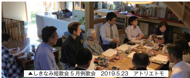
▲しきなみ短歌会 5月例会歌 2019.5.23 アトリエトモ