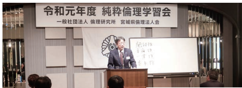
▲純粋倫理学習会 2019.5.15 バレスへいあん