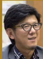
趣味 最近バイクに乗り始めた