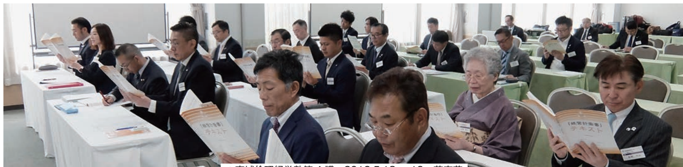
▲宮城倫理経営塾第4講 2019.5.18～19 茂庭荘