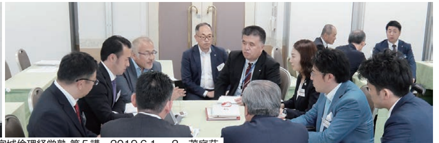
▲第19期宮城倫理経営塾 第5講 2019.6.1～2 茂庭荘