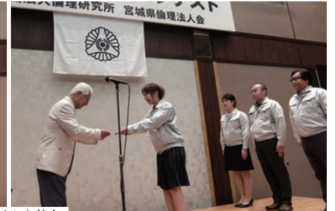
▲第10回活力朝礼コンテスト 2019.6.29 ホテルメルパルク仙台