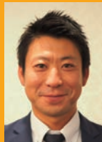
趣味 マラソン 鉄道