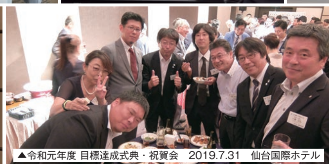
▲令和元年度 目標達成式典・祝賀会 2019.7.31 仙台国際ホテル