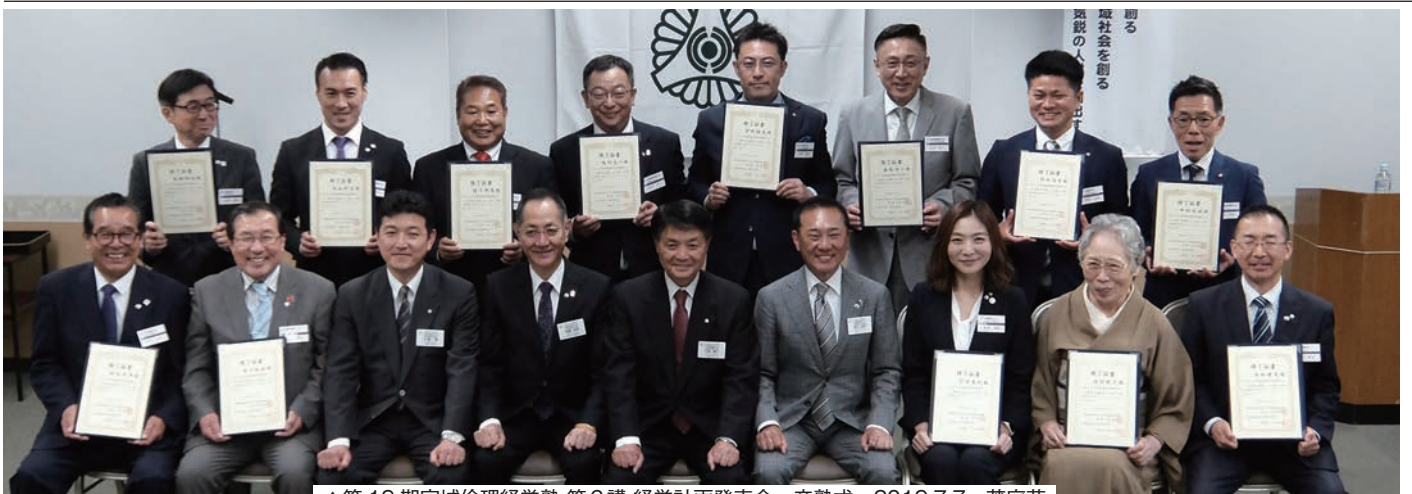
▲第19期宮城倫理経営塾 第6講 経営計画発表会・卒塾式 2019.7.7 茂庭荘