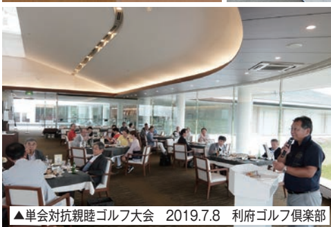
▲単会対抗親睦ゴルフ大会 2019.7.8 利府ゴルフ倶楽部