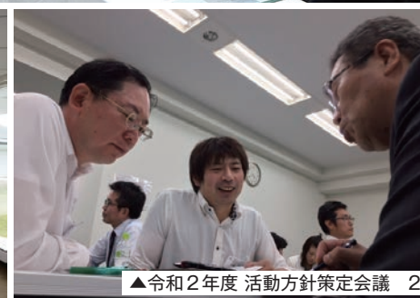
▲令和2年度 活動方針策定会議 2019.7.12 県事務局セミナールーム