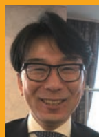
趣味 ゴルフ、人助け