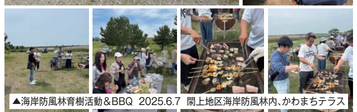
▲海岸防風林育樹活動&amp;BBQ 2025.6.7 関上地区海岸防風林内、かわまちテラス