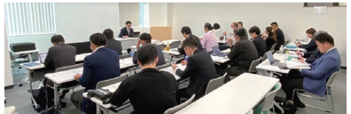
▲R7年度 第3回広報委員会 2025.5.13 県事務局セミナールーム