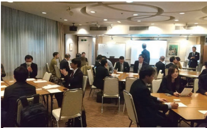
▲A地区合同新会員オリエンテーション 2025.4.25 スマイルホテル仙台