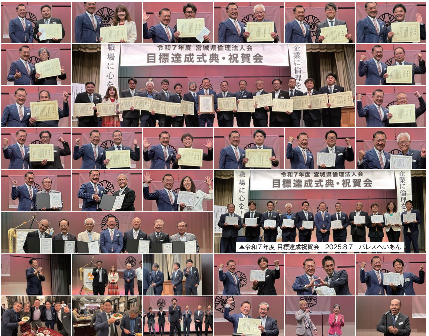
▲令和7年度 目標達成祝賀会 2025.8.7 パレスへいあん