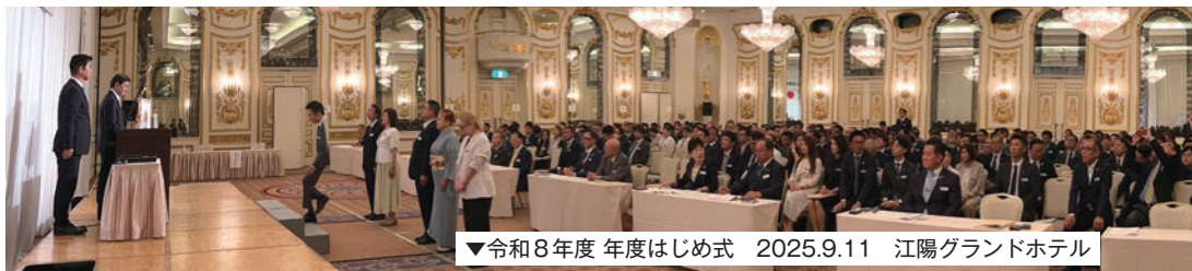
▼令和8年度 年度はじめ式 2025.9.11 江陽グランドホテル