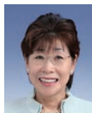
宮城県倫理法人会 副会長